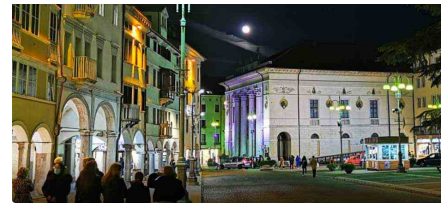
Belluno, attualità e politica Gruppo Pubblico - Membri: 2873