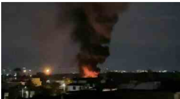
Marigliano, fiamme altissime: a fuoco un deposito di roulotte

Il progetto concentra l'attenzione su processi di creazione e potenziamento della comunità educante , sostenendo il sistema di relazioni e la collaborazione tra i diversi soggetti della comunità.