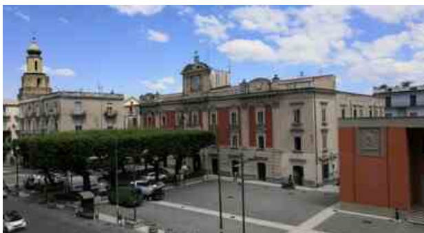
Rischio idraulico a Marigliano: messa in sicurezza