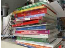
Lettere al direttore

elenera su Alberi secolari? "Ecoballe, cinquant'anni fa lì c'erano campi" ccerfoggia su Sottopassi ancora allagati a Busto Arsizio. Perché qualcuno ci finisce sempre dentro? Felira su Sottopassi ancora allagati a