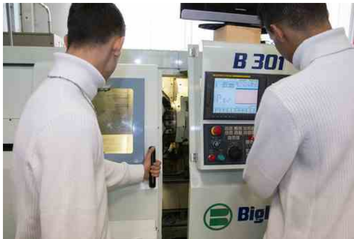
Engim lancia un progetto contro la dispersione scolastica e per aiutare i ragazzi dai 14 ai 19 anni

Sarà presentato domani "Riscoprire esperienze", il progetto che Engim sviluppa con il sostegno del fondo di JP Morgan per contrastare la dispersione tra i 14 e i 19 anni