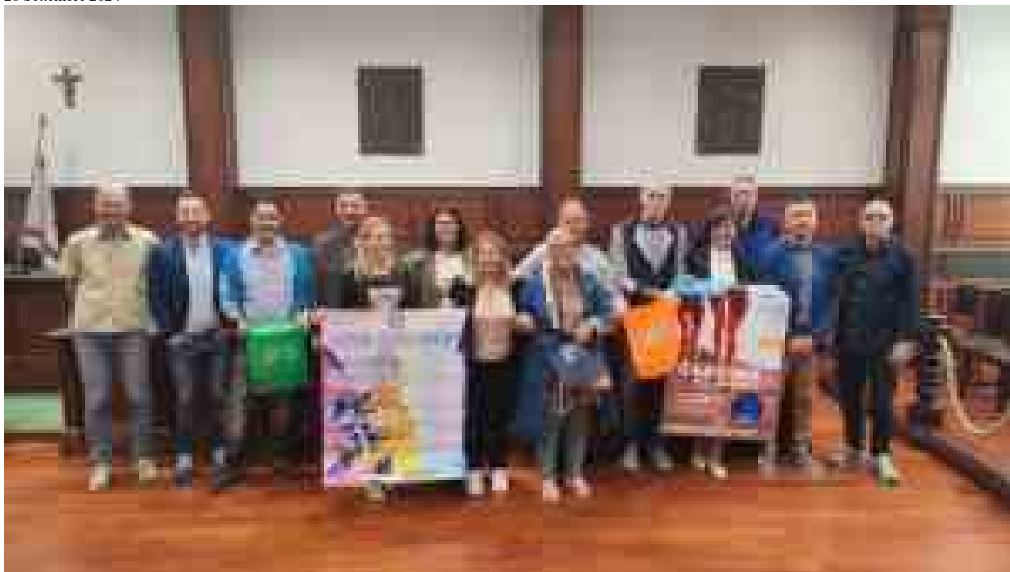
Cascina, presentata la Festa dello Sport