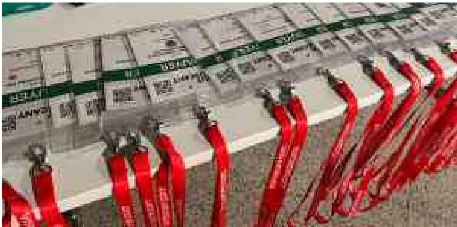
Terre di Pisa ospita Buy Tuscany 2024