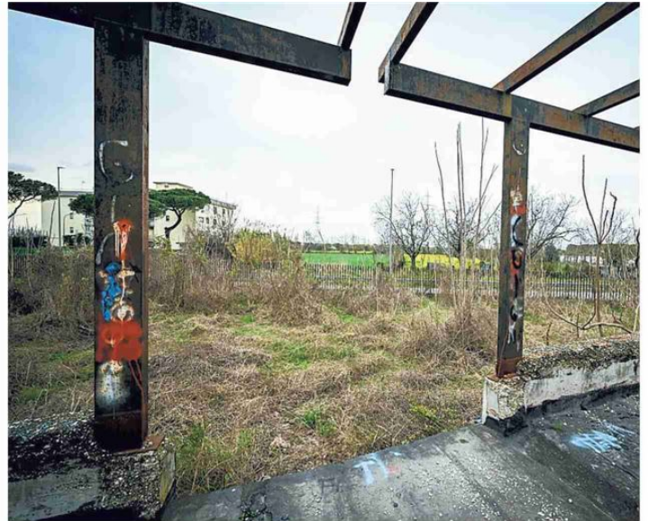
Le condizioni di totale abbandono di Villa Andersen