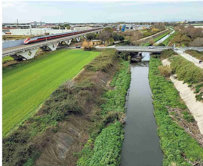
Una veduta dei Regi Lagni, a sinistra i binari dell'Alta velocità

Ben venga la creazione di un campus universitario che ospiterà le facoltà di Scienze Motorie