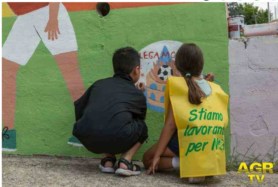
Lavori in corso, adottiamo la città...progetto legambiente

(AGR) La bellezza è nelle mani delle ragazze e dei ragazzi, che nel corso degli ultimi quattro anni hanno riscoperto e rigenerato gli spazi del loro quartiere. È l'esperienza dei giovani del progetto Lavori in Corso – Adottiamo la città di Legambiente, finanziato dall'Impresa sociale Con i Bambini tramite il Fondo per il contrasto alla povertà educativa , che si è svolto in cinque città molto diverse tra loro per localizzazione, dimensione, popolazione, complessità e storia, ma allo stesso tempo con caratteri omogenei, legati ai disagi della vita nella periferia: Roma, Palermo, Pisa, Tolentino (MC), Sant'Arpino (CE). Un'iniziativa che ha visto il protagonismo di ragazzi e ragazze alla scoperta del territorio, attraverso la riappropriazione degli spazi urbani e di vita, la costruzione dei legami nella comunità e il rafforzamento delle competenze scientifiche e di cittadinanza.