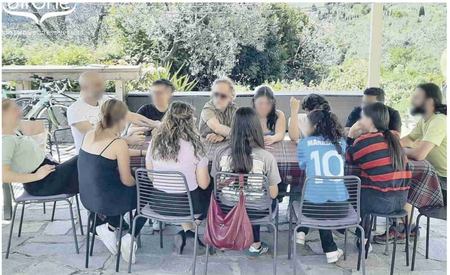
Nella foto a sinistra: i ragazzi coinvolti nel Progetto Airone seguiti dagli specialisti e tutor dell'associazione

«NOI DIAMO SOSTEGNO PSICOLOGICO, CI OCCUPIAMO ANCHE DI FORNIRE TUTOR E DI GARANTIRE UNA "DOTE" EDUCATIVA»