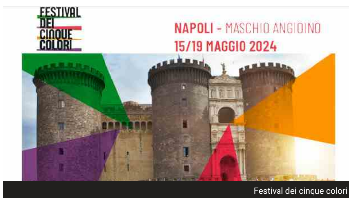
Festival dei cinque colori

Il festival, giunto alla seconda edizione, si terrà dal 15 al 19 maggio