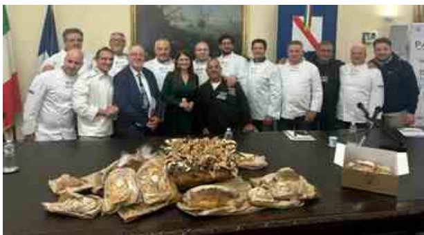
PaNeapolis a Napoli, la rassegna sul pane