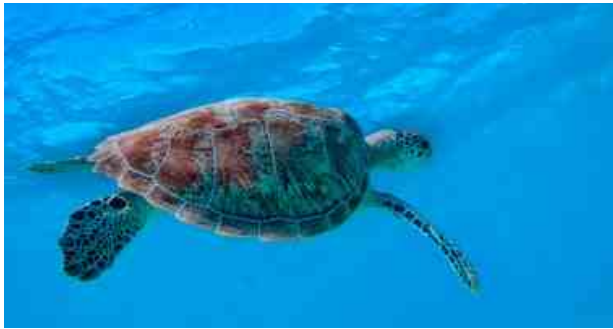
La salvaguardia delle tartarughe marine