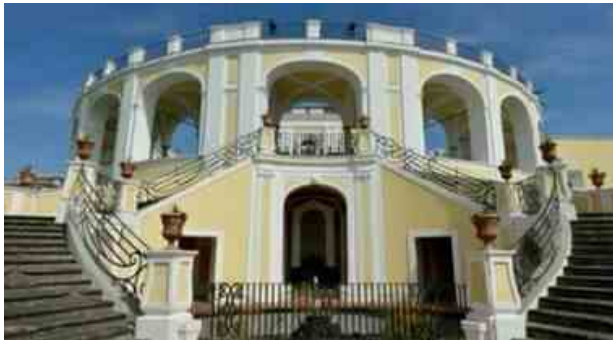
Naples Shipping Week 2024: la conclusione