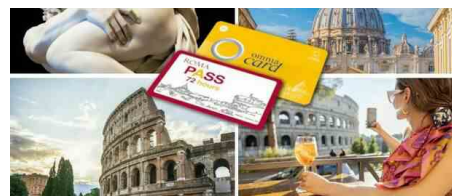
Roma Pass: visita Vaticano, Colosseo e tanti altri musei