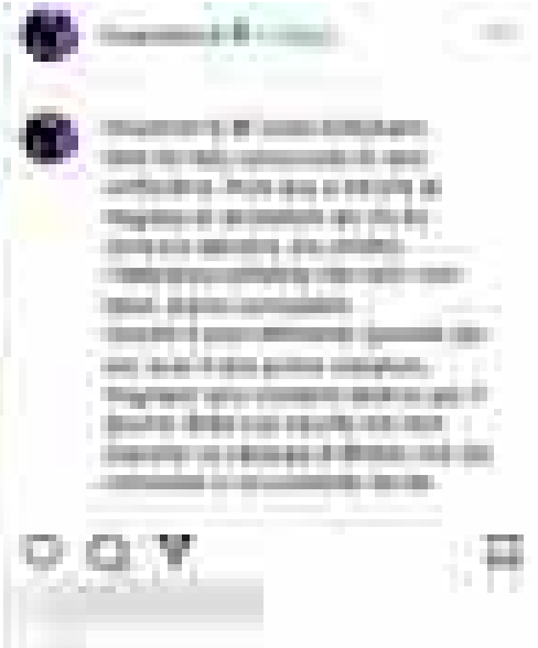
Tiziano Ferro: 'Esce il mio romanzo, ma sognavo scenario diverso'