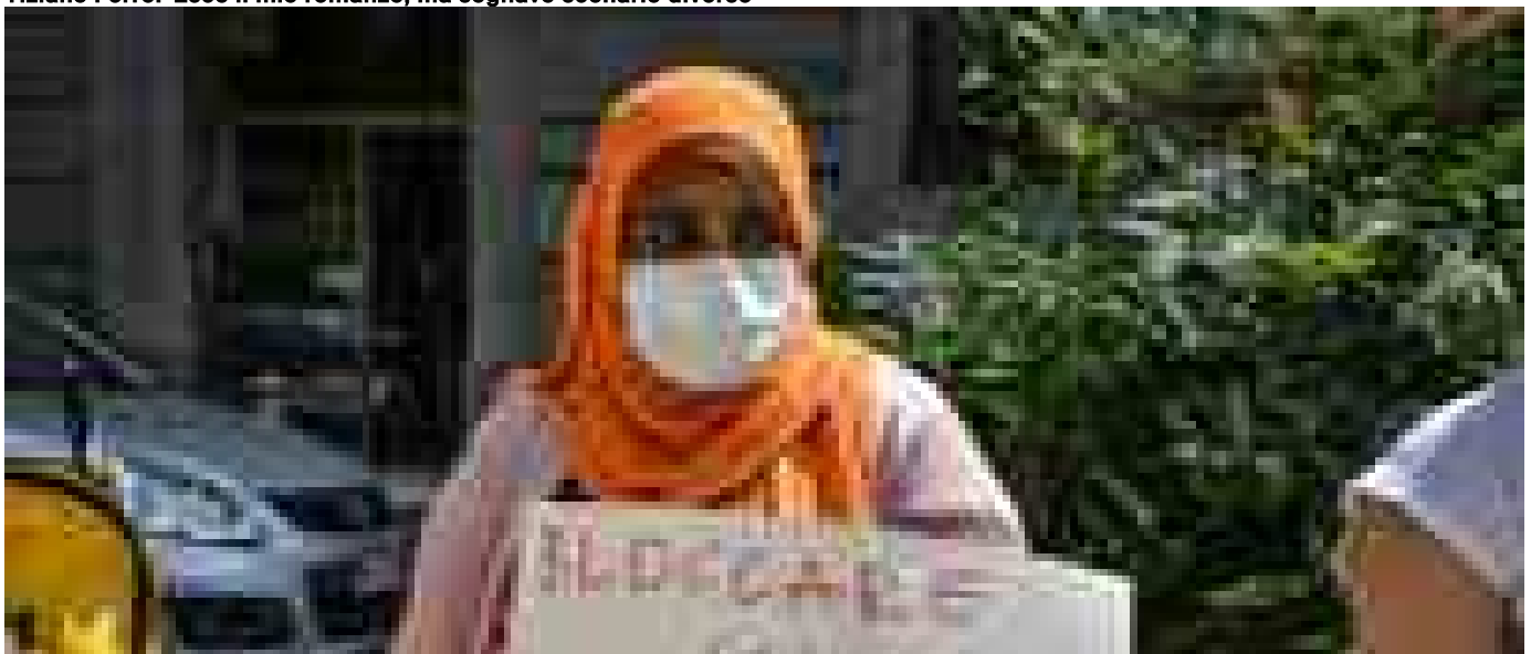
A Como parroco invita chi non ce l'ha a occupare una casa