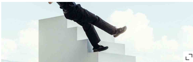
Yoann Bourgeois Art Company

Tra gli appuntamenti da non perdere gli spettacoli firmati Yoann Bourgeois Art Company , dell'artista francese, attore, acrobata, danzatore, circense, coreografo e giocoliere, ma anche set designer per spettacoli e videoclip come quello creato per "As It Was" di Harry Styles, così come per la sua celebre performance ai Grammy Awards 2023, e per l'esibizione di Marco Mengoni all'Eurovision 2023. Per BAM Circus presenterà "Approach 18. stairs / Touch", per la prima volta in Italia e alla seconda replica mondiale, che unisce danza e acrobazia con l'esibizione di un performer che fluttua nell'aria grazie a una struttura inserita al centro del parco, dotata di una scalinata e di un tappeto elastico. Sempre di Bourgeois, la performance "Democratie", anch'essa per la prima volta a Milano, vedrà la partecipazione attiva del pubblico, coinvolgendolo in un'esperienza che mette alla prova abilità di equilibrio del corpo e lotta alla forza di gravità. Entrambi gli appuntamenti avranno più repliche.