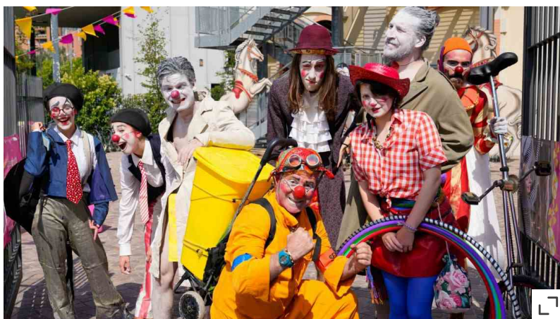
Milano Clown Festival

Biblioteca degli Alberi Milano, Fondazione Riccardo Catella. "Per tre giorni si potrà prendere parte a un viaggio immaginifico che accende sogni, creatività ed emozioni. Sarà un evento eccezionale, che terrà tutti con il fiato sospeso e il naso all'insù, grazie ai protagonisti che animeranno il parco di magia, mistero, bellezza e gioia. BAM si trasforma da teatro open air a parco magico con performance, laboratori e workshop che scioglieranno lo stress del quotidiano come farebbe un balsamo gentile capace di donare benessere, umanità e grandi sorrisi, come recita anche il nostro Manifesto delle Meraviglie, che tutti potranno sottoscrivere. Il mistero condurrà a nuovi incontri inaspettati, con altri passanti di BAM e con gli artisti di un circo fuori dal comune. BAM Circus è teatro, danza, musica, amicizia, il piacere di stare insieme in mezzo alla natura sentendosi uniti, semplicemente umani, nel più umano dei sentimenti: la Meraviglia."