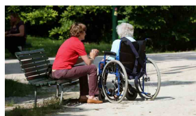
Necessità di servizi di cura e