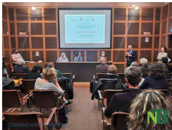
Cascina Oremo: al via le attività del progetto dell'Impresa sociale Con I bambini, mentre la Fondazione CRB prosegue con la ristrutturazione

Talento, inclusione, sostenibilità: sono queste le parole-chiave che