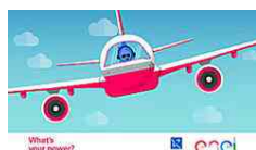
Vola gratis A/R in... Enel Energia