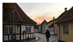
Solo in Danimarca si... Vacanze in Danimarca