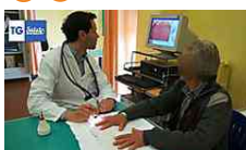
Nuova puntata del "TG..." In primo piano le nuove apparecchiature tecnologiche donate...